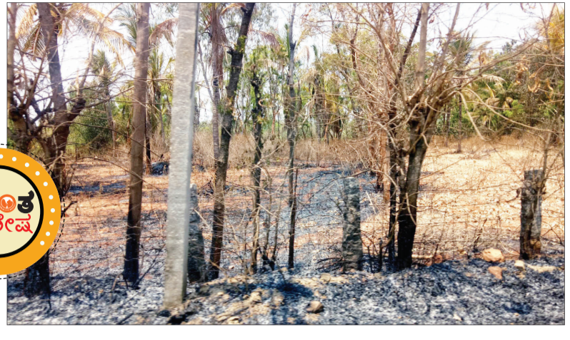
ಕಾಡಿನ ಪ್ರದೇಶದಲ್ಲಿ ತೀವ್ರತರದ ಬರಗಾಲದ ಮರಗಳು ಒಂದಕ್ಕೊಂದು ಸ್ಪರ್ಶಗೊಂಡು ಬೆಂಕಿ ಹತ್ತಿಕೊಂಡು ಕಡಲಾಗುತ್ತಿವೆ.