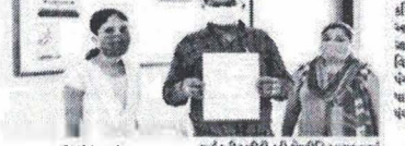
આહવા શ્રા. પંચાયતના મહિલા સરપંચ સામે અવિશ્વાસની દરખાસ્તથી રાજકારણ ગરમાયું છે...