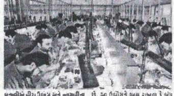
કાપડની યીરા ઉદ્યોગ અને હીરા ઉદ્યોગના કાર્યકર્તાઓની સંમતિથી સુરતમાં કાપડ તેમજ હીરા ઉદ્યોગને મોટા અંશે અસર થઈ છે...