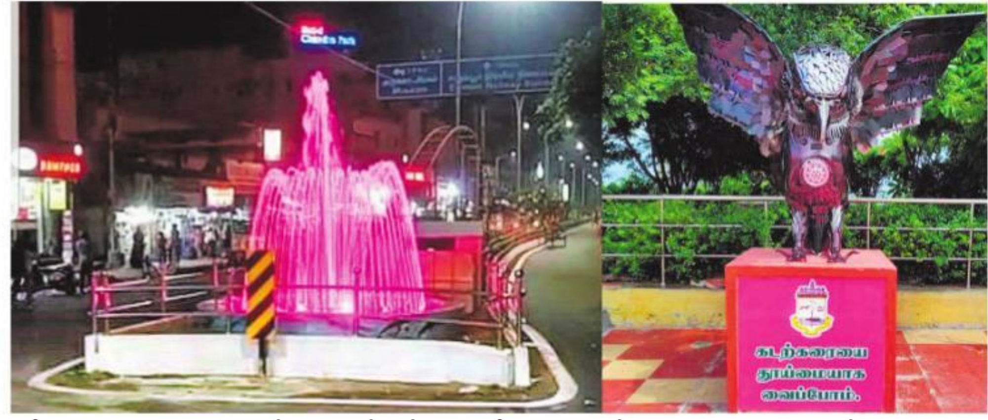
சென்னையை அழகுபடுத்தும் வகையில் மாநகராட்சி சார்பில் எழும்பூர் வேலைல் சாலையில் அமைக்கப்பட்டுள்ள வண்ண விளக்குகளை ஆன் செயற்கை நீருற்று (வலது) சென்னை எலிடல் கடற்கரை சாலையில் பயன்பாற்ற இயந்திர உதிரி பாங்குகளைக் கொண்டு அமைக்கப்பட்ட கருகு சிலை.