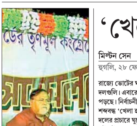
কলকাতা পুরসভার ১২৫ নম্বর ওয়ার্ডে তৃণমূলের কর্মী সম্মেলনে দলের মহাসচিব পার্থ চ্যাটার্জি। রবিবার।

ভোট ঘোষণার আগে থেকেই উত্তর ২৪ পরগনায় একগুচ্ছ উন্নয়নমূলক কাজ চলছে জোর কদমে। জেলার ৩০টি বিধানসভা এলাকায় রাস্তা, পানীয় জল, নদমা সংস্কারের কাজ করা হচ্ছে নিয়ম মেনে। একইসঙ্গে স্বাস্থ্যসার্থী কার্ড থেকে শুরু করে সমস্ত সরকারি প্রকল্পের কাজও চলছে। জেলার বিভিন্ন প্রান্ত থেকে রোহাই বারাসতে জেলাশাসকের দপ্তরে স্বাস্থ্যসার্থী কার্ড সংগ্রহ করতে আসছেন বহু মানুষ। ছটির দিনেও মানুষ যাতে সরকারি প্রকল্প থেকে সঞ্চিত না হন তার জন্য বাসন্তী প্রণাম।