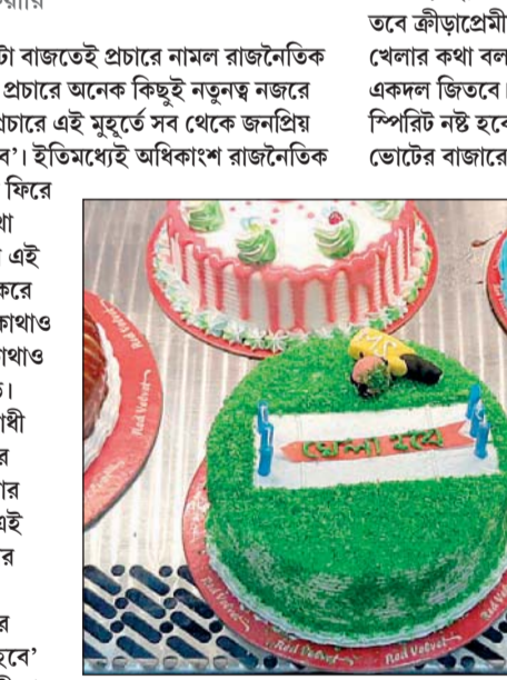
কাজে এল 'খেলা হবে' কেক।