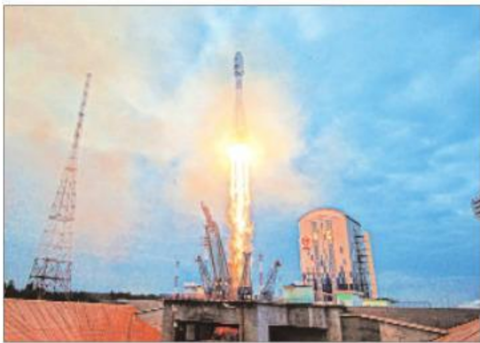
The Luna-25 spacecraft lifted off on August 11.

developed problems on Saturday as it tried to move into a pre-landing orbit.