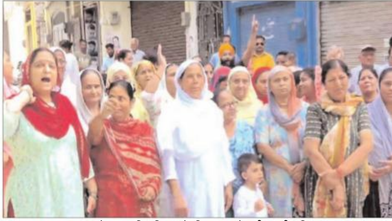
ऊना में जल शक्ति विभाग के खिलाफ नारेबाजी करती महिलाएं।

प्रदर्शनकारी महिलाओं ने इस दौरान इस समस्या को अनदेखा करने का आरोप लगाते हुए कहा कि करीब एक महीना पहले पानी की आपूर्ति में कीड़े और सीवरेज का गंदा पानी आने की समस्या सामने आने के बाद उस मामले को विभाग के समक्ष उठाया गया। इसके बाद शहर वासियों को यहां पर नई पाइपलाइन डालकर सुचारू और स्वच्छ पेयजल आपूर्ति देने की बात कही गई। लेकिन महीना बीतने के बावजूद नई पाइपलाइन बिछाने का काम शुरू नहीं हो पा रहा। जबकि पाइपलाइन बिछाने के चक्कर में शहर के रास्तों को भी उखाड़ दिया गया है। इससे स्कूलों बच्चों से लेकर घर में बीमार और बुजुर्ग लोगों को भी आने-जाने में दिक्कतों का सामना करना पड़ रहा है। लोगों