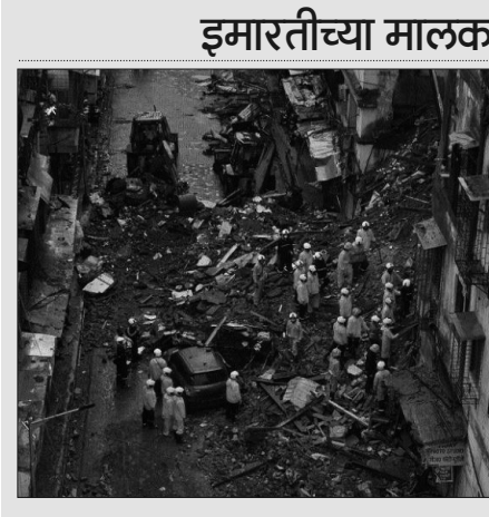
इमारतीच्या मालकाला दर महिन्याला नोटीस