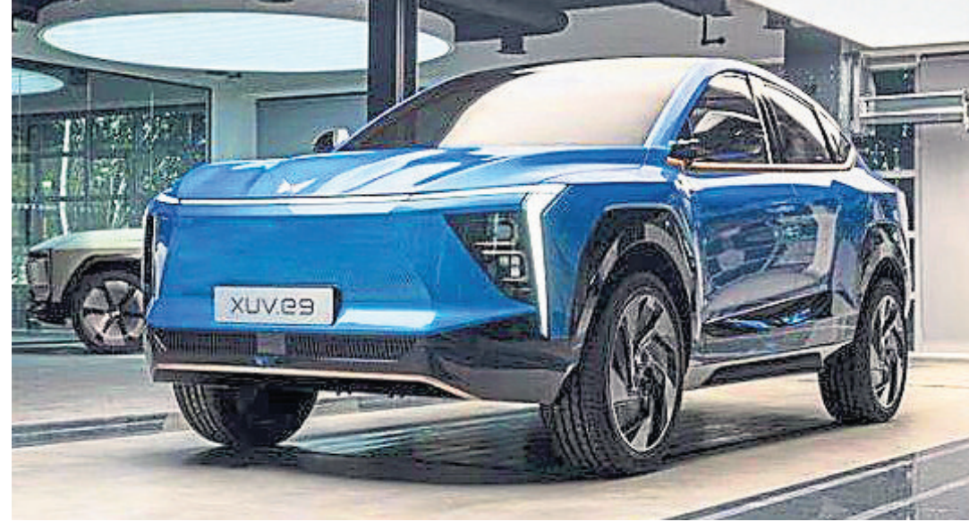
Known for its sport-utility vehicles and tractors, M&M has turned aggressive in pushing its EV play.

according to the statement. The M&M deal comes as Temasek, which manages $287 billion of global assets, doubles down on its investments in India. In FY23 alone, Temasek had put in around $2 billion in India with investments in smart appliances maker Atomberg, subscription-based food startup Country Delight, nutrition and well-