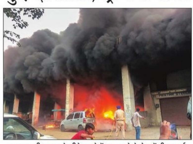
नुकसान : नीलम पुल के नीचे कबाड़ में आग लगने से दो कारें भी जल गईं।

फरीदाबाद। नीलम चौक स्थित रेलवे ओवरब्रिज (आरओबी) के नीचे भरे कबाड़ में बृहस्पतिवार शाम आग लगने से अफरा-तफरी मच गई। आग से ओवरब्रिज के चार पिलर बुरी तरह क्षतिग्रस्त हो गए हैं। ओवरब्रिज के नीचे खड़ी दो कारों का भी कुछ हिस्सा आग की चपेट में आने से जल गया। सात दमकल गाड़ियों ने दो घंटे की कड़ी मशकत के बाद आग पर काबू पाया। एहतियात के तौर पर ओवरब्रिज के ऊपर से वाहनों के आवागमन पर रोक लगा दी गई। हालांकि, रात 8 बजे अचररीदा चौक से नीलम चौक की ओर का रास्ता खोल दिया गया। आग लगने के कारणों का फिलहाल पता नहीं चल पाया है। शहर के सबसे व्यस्ततम नीलम चौक स्थित आरओबी के नीचे आसपास के इलाके के लोग कबाड़ डाल देते हैं। यहीं पर कबाड़ की छंट्टाई करते हैं। ऐसे में आरओबी के नीचे कबाड़ का ढेर लगा है। शाम करीब चार बजे अचानक कबाड़ के ढेर में आग लग गई। देखते ही देखते आग ने विकराल रूप धारण कर लिया। ब्यूरो