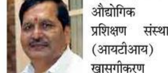
कौशल्य, रोजगार, उद्योजकता

पुणे, ता. १७ : 'राज्यातील ४९९ शासकीय औद्योगिक प्रशिक्षण संस्था (आयटीआय) खासगीकरण मंगलप्रभात लोढा करण्यसाठी खुल्या करण्यात येत आहेत. हे खासगीकरण नसून एकरूपण आहे. यात शासकीय 'आयटीआय' वरील सरकारची मालकी कायम राहणार आहे. केवळ 'आयटीआय'चा विकास आणि क्षमता वाढविण्यासाठी मोठमोठ्या उद्योगसमूहांसह स्वयंसेवी संस्थांचे सहकार्य घेतले जाणार आहे,' अशी माहिती राज्याचे कौशल्य रोजगार उद्योजकता व नावोन्नत मंत्री मंगलप्रभात लोढा यांनी दिली.