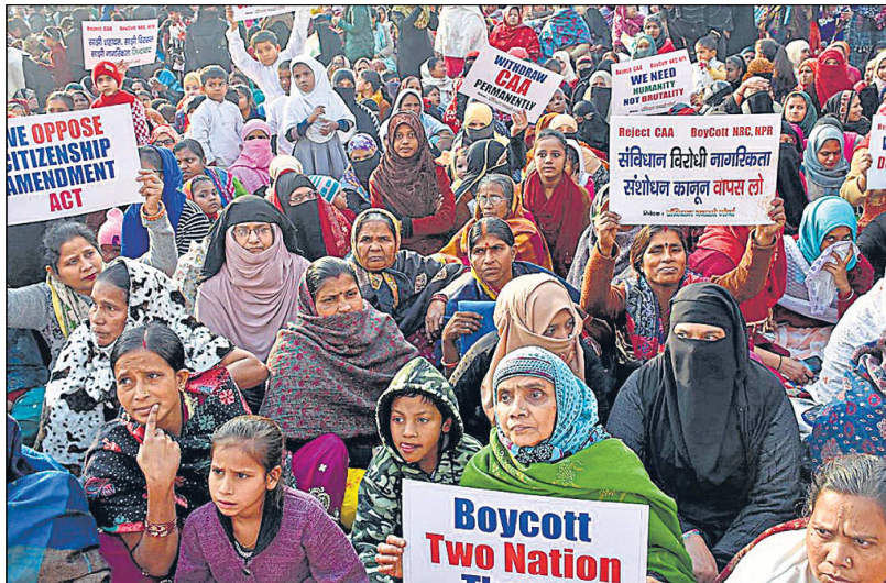
बिहार के गया स्थित शांतिबाग में मंगलवार को सीएए के विरोध में चल रहे धरने में शामिल महिलाएँ।