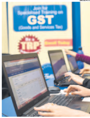
About 40 orders may be issued shortly on complaints against firms across sectors.

In the past, about 60% of the cases investigated by the Directorate General of Anti-Profiteering (DGAP) have confirmed profiteering behaviour by businesses. The NAA has issued orders on more than 100 cases since it came into force in November 2017. Its orders have led to businesses depositing about ₹600 crore in profiteered amount to a consumer welfare fund managed by the consumer affairs ministry, said