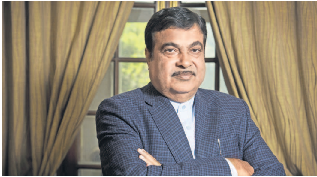
Micro, small and medium enterprises (MSME) minister Nitin Gadkari.

“The MSMEs are rightly labelled as the backbone of Indian economy, given their wide presence in every sector and their close relationship with larger companies as suppliers