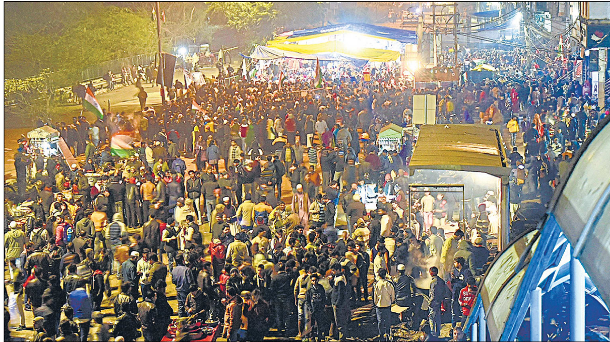
शाहीनबाग इलाके में नागरिकता संशोधन कानून के खिलाफ मंगलवार को बड़ी संख्या में लोग सड़कों पर उतरे।

यह उठाया मुद्दा: याचिका में कहा गया कि कालिंदी कुंज वाला रास्ता दिल्ली, फरीदाबाद और नोएडा को जोड़ता है। यह बंद होने से लोगों को डीएनई एवं अन्य वैकल्पिक रास्तों का इस्तेमाल करना पड़ रहा है, जिससे भारी जाम लगता है। इससे समय और ईंधन की बर्बादी हो रही है। इस पर पीठ ने पुलिस से कहा कि वह जनहित और कानून-व्यवस्था को ध्यान में रखते हुए मामले पर समयबद्ध रूप से गौर करे।