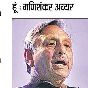
पूर्व कांग्रेसी नेता मणिशंकर अय्यर भी मंगलवार रात प्रदर्शनस्थल पर पहुंचे।