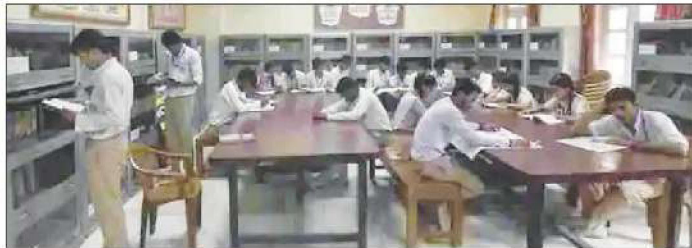
The principal of another government school in Karawal Nagar, also on condition of anonymity, said, "Twenty-eight of our 83 permanent teachers are

drive, and identification of travellers from abroad at the airport, among others. They include primary teachers, trained graduate teachers (TGTs), and postgraduate teachers (PGTs). While TGTs can teach up to class 10, PGTs are eligible to teach classes 11 and 12. Officials at several schools said it would be difficult for them to reopen when they are short of hands. The principal of a government school in west Delhi's Madipur, on condition of anonymity, said all their science, mathematics and social science teachers (TGTs) are currently on Covid duty. "We have one guest teacher each for science and mathematics, and there are four sections of class 10. We will have to divide one section