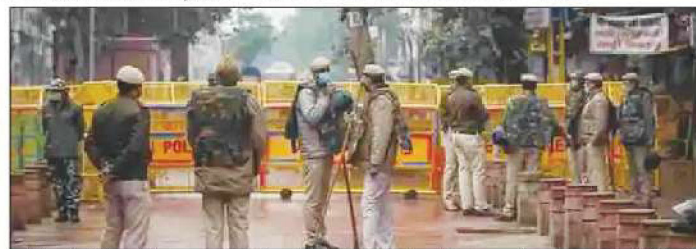
The submissions of the police came in response to a plea by two AAP leaders, challenging the denial of permission by the police to hold protests outside the homes of Shah and Bajaj.

MM BUREAU New Delhi/January 15 The Delhi Police told the Delhi high court that AAP MLAs Raghav Chadha and Atishi Marlena cannot be granted permission to protest outside the residences of home minister Amit Shah and lieutenant-governor Anil Bajaj as political gatherings are prohibited by the state disaster management authority, DDMA, till January 31. The police also said their commissioner had taken out a standing order in 2018 with respect to the protests at important places in accordance to the orders passed by the Supreme Court. They added that prohibitory orders have been issued under Section 144 of the Criminal Procedure Code (CrPC) for the entire central Delhi where the two residences are located.