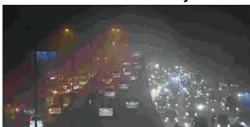
checked with the total sale of petroleum products," the study reads. CO, a colourless and odourless gas, is highly toxic and produced by the incomplete combustion of fossil fuels, oil, coal, woods, and natural gas. Scientists said CO was more harmful than particulate matter, as it has the potential to

fall in Mumbai. It also showed that the biggest reason behind this reduction, especially in Delhi, was restrictions in traffic movement. In the Capital, CO emissions from vehicular movement fell from 31.01 gigagrams/month (Gg/month) on regular days to just 5.13 Gg/month during the lockdown. The use of unclean household fuel was the second biggest CO in Delhi contributor, adding 1.35 Gg/month when no curbs were in place. Notably, however, this number showed no deviation even during the lockdown. The major sources of CO in Delhi were transport and household during normal time. Transport was completely shut during the lockdown except for vehicles from law enforcement agencies, emergency services and that of essential supply chains. Not more than 10% of total vehicles were on the road, as also cross-