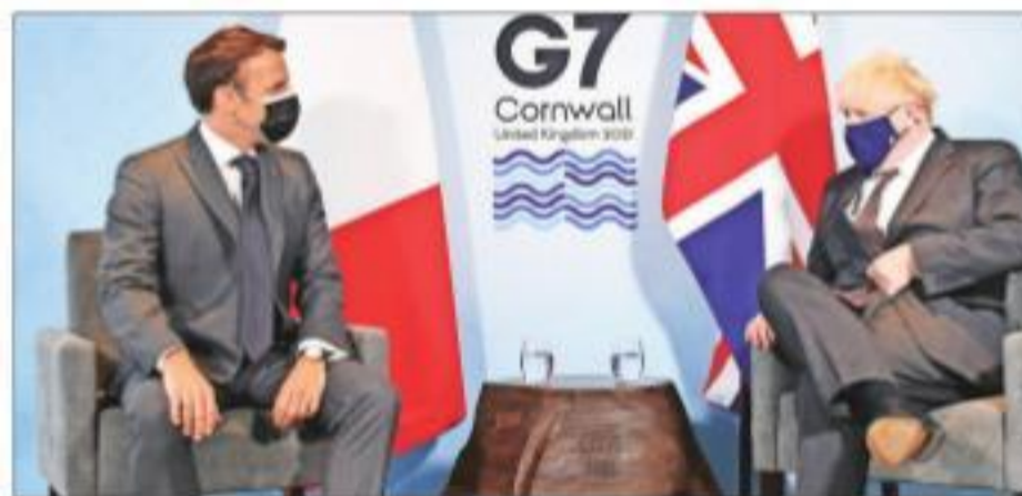
Boris Johnson and Emmanuel Macron attend a bilateral meeting during the G7 summit in England