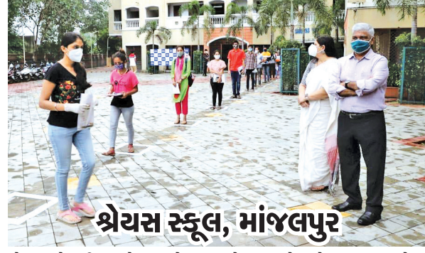
શેરયા સ્કૂલ, માંજલપુર હોમ ક્વોરન્ટીન થયેલા શહેરના એક વિદ્યાર્થીએ રવિવારે બપોરે ગુજરાત માધ્યમિક શિક્ષણ બોર્ડમાં ફોન કરીને પરીક્ષા આપવા માટે માંગણી કરી હતી. વિદ્યાર્થીના ફોન બાદ બોર્ડમાંથી ડી.ઈ.ઓ કચેરીને