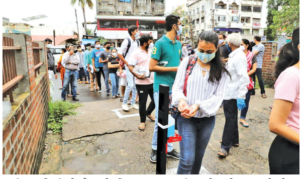
સહીતના ડિગ્રી કોર્સમાં એડમિશન મેળવવા માટે લેવામાં આવતી ગુજકેટની પરીક્ષા આજે શહેરના કુલ ૩૮ કેન્દ્રો પર યોજાવામાં આવી હતી. જેમાં શહેરમાંથી ૭૬૦૦ વિદ્યાર્થીઓ નોંધાયા હતા. આજની

વડોદરા, તા. ૨૪ કોવિડ-૧૯ની ગાઈડલાઈનના યુક્ત અમલ વચ્ચે આજે શહેરના કુલ ૩૮ કેન્દ્રો ખાતે ૭૬૦૦ વિદ્યાર્થીઓ માટે ગુજકેટની પરીક્ષાઓ યોજાઈ હતી. આ પરીક્ષામાં એક કોરોના સંક્રમિત વિદ્યાર્થી અને એક કેન્સર પીડિત વિદ્યાર્થીનીની પરીક્ષા આપવાની હોવાથી આ ૨ વિદ્યાર્થીઓ માટે વડોદરા જિલ્લા શિક્ષણાધિકારી કચેરી દ્વારા શહેરની ૨ સ્કૂલમાં અલગ રૂમની વ્યવસ્થા કરવામાં આવી હતી. કોરોના મહામારી બાદ આજે સૌપ્રથમ વખત વિદ્યાર્થીઓની વર્ગખંડમાં પરીક્ષા લેવાઈ હતી. ધોરણ ૧૨ વિજ્ઞાન પ્રવાહની પરીક્ષા આપ્યા બાદ એન્જનીયરીંગ