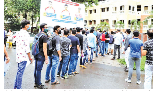
કોરોનાનો ચેપ અન્ય વિદ્યાર્થીઓને ન લાગે તે માટે સ્કૂલમાં કોરોનાગ્રસ્ત વિદ્યાર્થી માટે અલગ જ એક રૂમ ફાળવવામાં આવ્યો હતો અને પરીક્ષા પૂર્ણ થયા બાદ રૂમને સેનેટાઈઝ કરવામાં આવ્યો હતો અને સ્કૂલ દ્વારા

હતો. જેમાં વોકેટરે જણાવ્યું હતું કે, કેન્સર પીડિત વિદ્યાર્થીનીની બધાની વચ્ચે રાખવી જોખમકારક હોવાથી અલગ રૂમની વ્યવસ્થા કરવી. જેથી તેના માટે સમા વિસ્તારની નવરચના વિદ્યાલયમાં અલગ રૂમની વ્યવસ્થા કરવામાં આવી હતી. કોવિડ-૧૯ની ગાઈડલાઈન પ્રમાણે થર્મલ ગનમાં જે વિદ્યાર્થીઓનું ટેમ્પરેચર વધારે આવે, અથવા તો કોવિડના શંકાસ્પદ લક્ષણો જણાવે તેવા તમામ વિદ્યાર્થીઓ માટે અલગ રૂમની વ્યવસ્થા કરવામાં આવ્યો જન હતું. જોકે, સદ્ગતિથી શહેરમાંથી આ બે વિદ્યાર્થીઓ સિવાય અન્ય કોઈ વિદ્યાર્થી માટે અલગ રૂમની વ્યવસ્થા કરવાની જરૂર પડી ન હતી.