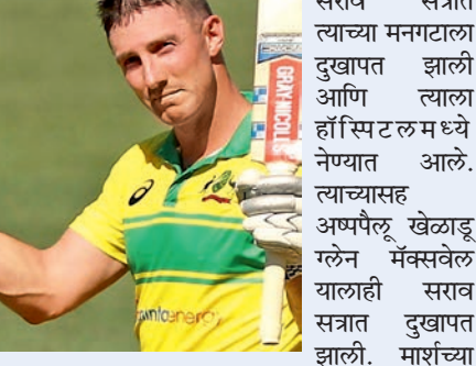
सराव सत्रात त्याच्या मनगटाला दुखापत झाली आणि त्याला हॉस्पिटल मध्ये नेण्यात आले. त्याच्यासह आपले खेळाडू ग्लेन मॅक्सवेल यालाही सराव सत्रात दुखापत झाली. मार्शाला मनागटाला झालेली दुखापत गंभीर असून त्याने स्पर्धेतून माघार घेतली आहे. मॅक्सवेल हॉस्पिटलमध्ये उपचार घेत असल्या तरी त्याच्या दुखापतीबाबत अद्याप स्पष्ट माहिती मिळालेली नाही. नियमित सराव करत असताना पॅट कमिन्सच्या गोलंदाजीवर मार्शाला ही दुखापत झाली. दुसरीकडे मिचेल स्टार्कच्या गोलंदाजीवर मॅक्सवेलला दुखापत झाली. 'सराव सत्रात मार्शाला उजव्या हाताला दुखापत झाली आणि दुट्टावने त्याच्या मनगटावर सर्जरी करावी लागणार आहे, असे ऑस्ट्रेलियाचे प्रशिक्षक स्टीन लॅंगर यानी सांगितले.

लंडन. वर्ल्ड कप स्पर्धेच्या गुणांतालिकेत ऑस्ट्रेलियाचा संघ अन्वळ स्थानावर विराजमान आहे आणि अखेरच्या साखळी सामन्यात विजय मिळवून हे स्थान कायम राखण्याचा त्यांचा निर्धार आहे. पण, उपांत्य फेरीत तगड्या संघाचा सामना करण्यापूर्वीच उद्या शनिवारी दक्षिण आफ्रिकेविरुद्ध होणाऱ्या अखेरच्या साखळी सामन्यात आगोदर ऑस्ट्रेलियाला दोन मोठे धक्के बसले आहेत. पाच वेळा वर्ल्ड कप उंचावणारा ऑस्ट्रेलियाचा संघ उपांत्य फेरीत इंग्लंड किंवा न्यूझीलंड यापैकी एकाचा सामना करण्यासाठी सज्ज आहे. पण, त्यांच्या दोन तगड्या फलंदाजांना दुखापतीने प्रासले आहे. त्यामुळे एकाला हॉस्पिटलमध्ये धाव घ्यावी लागली, तर एकाने स्पर्धेतूनच माघार घेतली. या सामन्यापूर्वी फलंदाज शॉन मार्शलला वर्ल्ड कप स्पर्धेतूनच माघार घ्यावी लागली आहे.