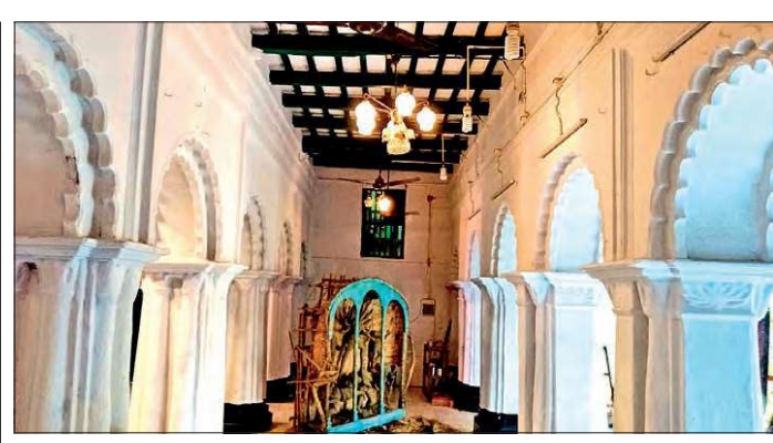
শুরু হয়েছে গোস্বামী বাড়ির পুজোর প্রতিমা গড়ার কাজ।

সেজ্বরি প্লাইবোর্ডস (ইভিয়া) লিমিটেড এর পর