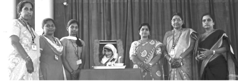
அன்னை வோளங்கண்ணி மகனார் கல்லூரியில் புனித அன்னை தெரசாவின் 113-வது பிறந்தநாள் விழா