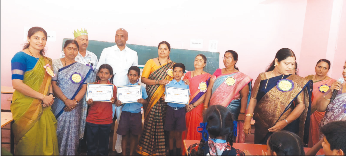
ಕೊಡಿಸುವ ಮೂಲಕ ಮುಖ್ಯ ಕಾರಣರಾಗಿದ್ದಾರೆ. ಕೃಷ್ಣಯ್ಯ ಶೆಟ್ಟಿ ಅಂಡ್ ಸನ್ಸ್ ಟ್ರಸ್ಟಿ ಪೌಂಡೇಷನ್ ನಿರ್ಮಾಣ ಮಾಡಿರುವ ಲೈಬ್ರರಿ ಮಕ್ಕಳ ಜ್ಞಾನ ಹೆಚ್ಚಿಸಲು ಸಹಕಾರವಾಗಲಿದೆ. ಇನ್ನೂ ಹಲವಾರು ದಾನಿಗಳ ಸಹಕಾರದಿಂದ ಅಂಬೇಡ್ಕರ್ ನಗರ ಸರ್ಕಾರಿ ಶಾಲೆ ಯಾವುದೇ ಖಾಸಗಿ ಶಾಲೆಗಿಂತ ಕಡಿಮೆ ಇಲ್ಲದ ಮಾದರಿ ಶಾಲೆಯಾಗುವ ಹಂತದಲ್ಲಿದೆ ಎಂದು ತಿಳಿಸಿದರು.