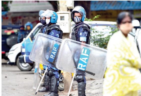
Rapid Action Force (RAF) personnel carry out a flag march in the riot-hit area, where a mob went on a rampage on last week over a social media post allegedly posted by a Congress MLA's relative, in Bengaluru on Monday.

PTI, BENGALURU: The Karnataka government on Monday said it has decided to approach the High Court for appointment of 'Claim Commissioner' for the purpose of assessment of damages caused to private and public property during last week's violence in the city, and recover the costs from the culprits.