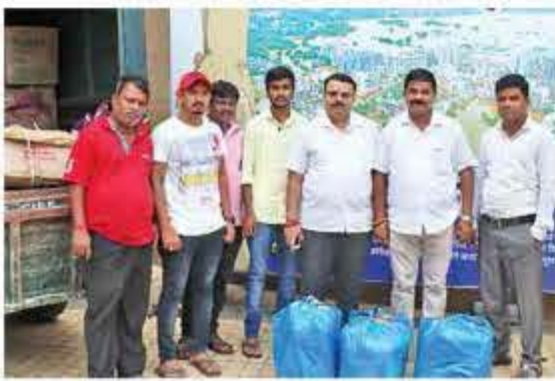
■ नेरुळ प्रभाग क्र. १६-१७ शिवसेना नगरसेवकांतर्फे मदत.