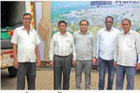
■ सानपाडा देवस्थान ट्रस्टतर्फे अन्नधान्य.

■ 'सकाळ' रिलीफ फंडा'कडून मिळालेल्या मदत साहित्याची ग्रामपंचायतीने दिलेली पोचवावती.