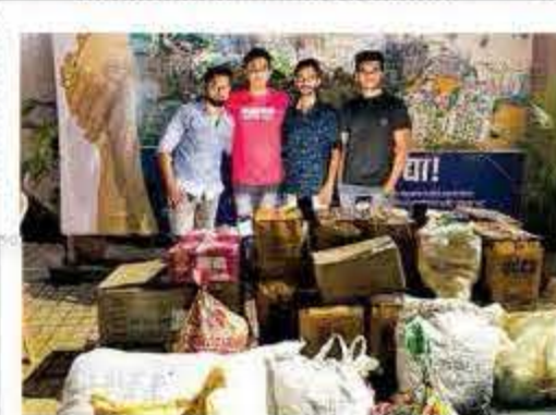
■ सानपाडा येथील युवा फाऊंडेशनतर्फे मदत.