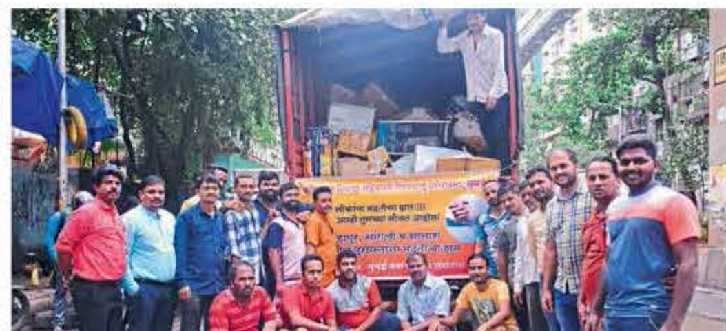
■ कोल्हापूर जिल्हा रहिवासी शिवाहा प्रतिष्ठान, मुंबई यांच्यातर्फे पूरग्रस्तांना मदत.