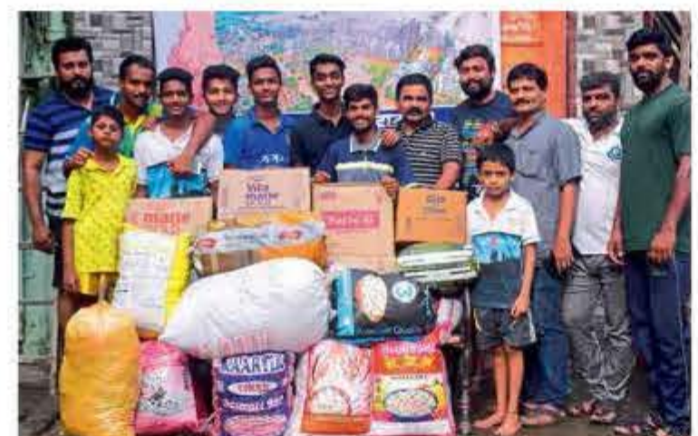
■ साफल्य संघ करी रोड मंडळातर्फे पूरग्रस्तांना मदत.