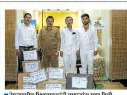
■ नेरुळमधील शिक्षाचालकांनी पूरग्रस्तांना मदत दिली.