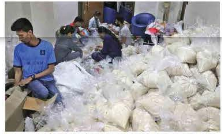
■ मदत म्हणून आलेल्या साहित्याचे वर्गीकरण करताना महाविद्यालयीन विद्यार्थी.