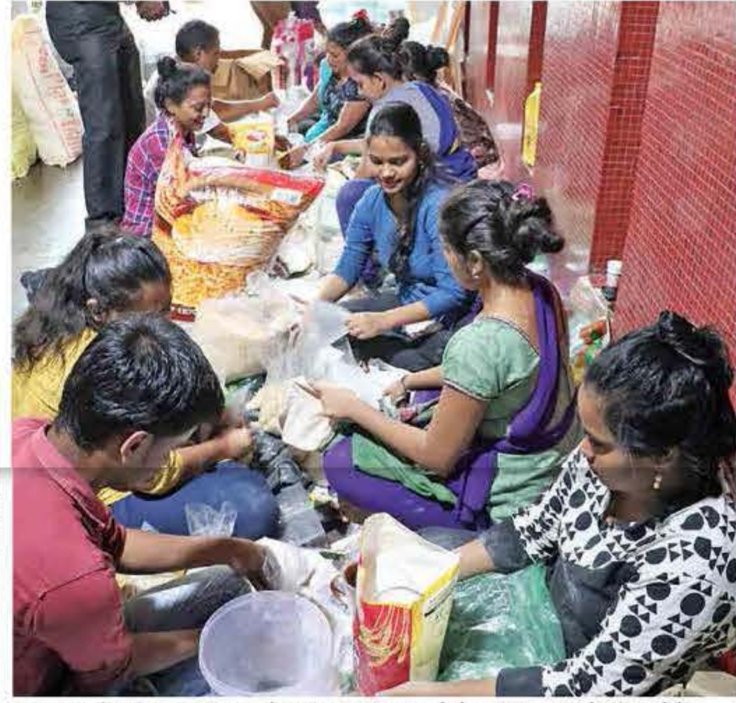
सकाळ कार्यालयातील सहकाऱ्यांसह स्वयंसेवकांनी मंगळवारी दिवसभर वेगवेगळ्या मदत साहित्याचे वर्गीकरण केले.

महापुराने वेढलेल्या कोल्हापूर, सांगली आणि सातारा जिल्ह्यातील उद्ध्वस्त झालेले हजारो संसार सावरण्यासाठी मुंबईकरांना मदतीचे शिवधनुष्य पेलण्याचे आवाहन 'सकाळ'ने केले होते. त्याला उदंड प्रतिसाद मिळत असून, सलग चौथ्या दिवशीही मोठ्या प्रमाणात जीवनावश्यक साहित्य 'सकाळ' कार्यालयात मुंबईकरांनी जमा केले. मुंबईसह उपनगरांमधून आलेल्या विविध साहित्यामुळे 'सकाळ' कार्यालय अक्षरशः तुडुंब भरले आहे. पाच हजार लिटर पाण्याच्या बाटल्या, तब्बल दहा हजार किलो अन्न-धान्य व खाऊचे पुडे, स्वच्छतेचे साहित्य, लहान मुले, महिला व पुरुषांसाठी कपडे आदी जीवनावश्यक साहित्य घेऊन ट्रेलर पूरग्रस्तांच्या मदतीसाठी रवाना झाला. सकाळ, साम, यिन आणि महाविद्यालयातील विद्यार्थी स्वयंसेवकांच्या मदतीने सर्व साहित्यांचे वर्गीकरण करण्यात आल्यानंतर भरपावसात भिजत ट्रेलर भरून रवाना करण्यात आला.