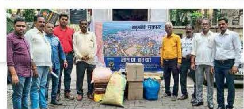
■ परळच्या सुभाष डामरे मित्र मंडळातर्फे पूरग्रस्तांना मदत.

Sakalreliefund.com संपर्क : 8888809306 / 9820984959 ई-मेल : support@sakalreliefund.com / esakal.in/srf