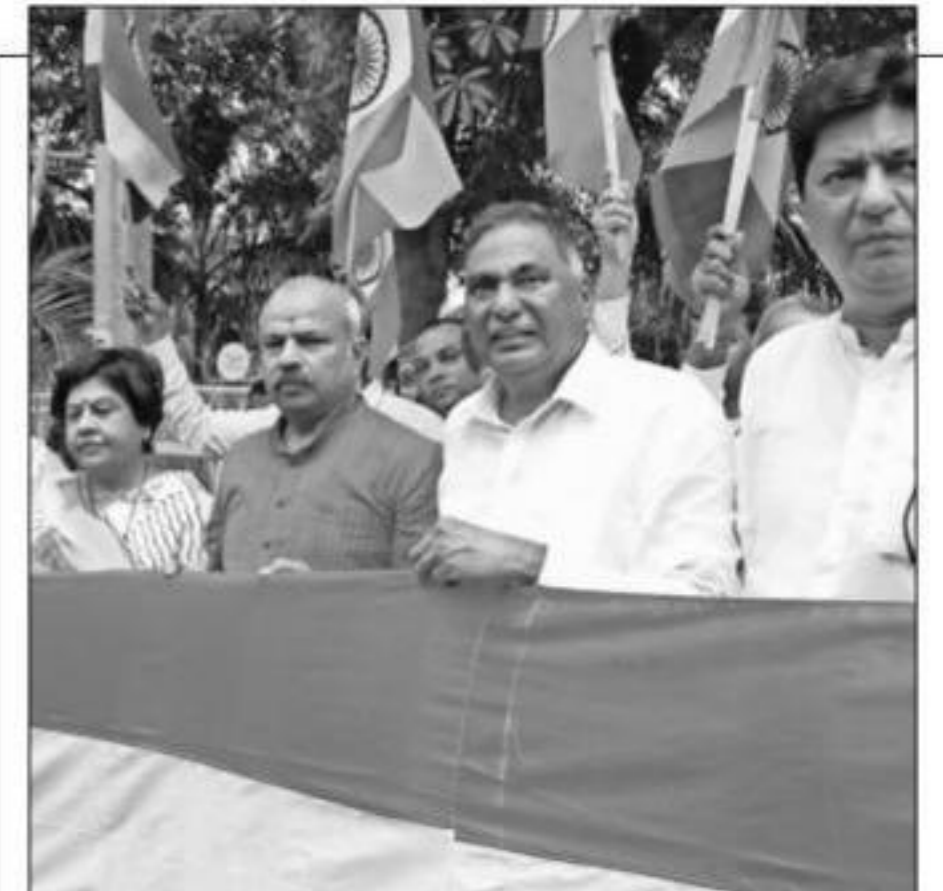
शृंखला तिरंगा यात्रा के तहत भारतीय जनता पार्टी दिल्ली के नेताओं ने मानव शृंखला बनाई।