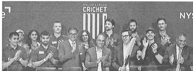
MLC was launched earlier this month with the ringing of the closing bell at the New York Stock Exchange

Major League Cricket, which begins on July 14, has huge aspirations, but national players will need a no-objection from their boards to participate