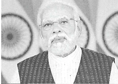
■ 13-14 जुलाई को है प्रधानमंत्री का फ्रांस दौरा ■ फ्रांस के राष्ट्रपति एमैनुएल मैक्रों प्रधानमंत्री को पेरिस में भोज की मेजबानी करेंगे तथा निजी रात्रि भोज भी देंगे ■ 15 जुलाई को संयुक्त अरब अमीरात के दौरे पर जाएंगे मोदी

प्रधानमंत्री नरेंद्र मोदी फ्रांस को दो दिन की यात्रा पर गुरुवार को रवाना हो रहे हैं। वहां से लौटते हुए प्रधानमंत्री एक दिन के लिए संयुक्त अरब अमीरात भी जाएंगे। प्रधानमंत्री को फ्रांस यात्रा दोनों देशों की रणनीतिक साझेदारी को 25 वीं वर्षगांठ के मौके पर हो रही है। मोदी पेरिस में राष्ट्रपति एंड्रियस मैकिरॉन के रूप में शामिल होंगे।