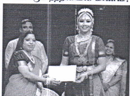
குரு தகதிர் சாதனம் பெற்ற வைஷ்ணவி... நாள் முழுக்கப் பேசவைக்கும் நந்தினியின் மாணவி!