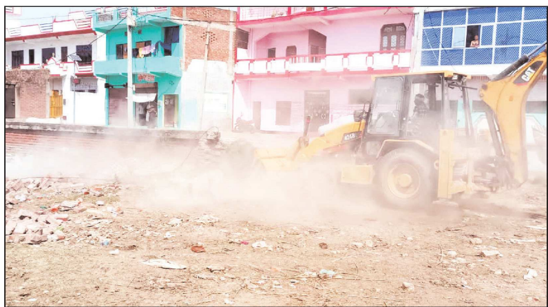
ओपन जिम के लिए प्रस्तावित भूमि से अतिक्रमण हटाती पुलिस।