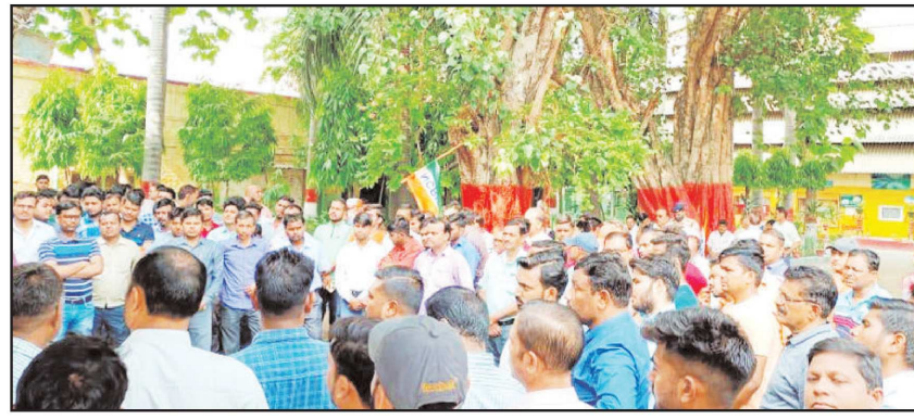
प्रदर्शन करते रेल कर्मियों।

कानपुर (एसएनबी)। विद्युत लोको शेड में कार्य के लिए एक निजी कंपनी को आमंत्रण देने को रेलवे कर्मियों ने निजीकरण की राह बताया। शेड के कर्मियों ने कहा कि सरकार की नीतियां कर्मचारी विरोधी हैं। इसका यह विरोध करेंगे। इस आमंत्रण के विरोध में रेलवे कर्मियों ने एनसीआरईएस के वैनर तले शेड के बाहर जोरदार प्रदर्शन किया। प्राद र्श न क र्ाी कर्मियों का कहना था कि केन्द्र सरकार की नीतियां निगमिकरण एवं मजदूर विरोधी हैं। विद्युत लोको शेड में कार्य करने के लिए एक