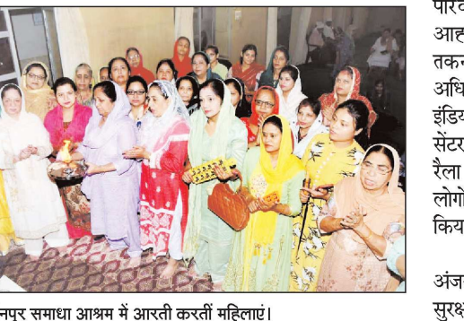
बर-मर्दनपुर समाधा आश्रम में आरती करती महिलाएं।