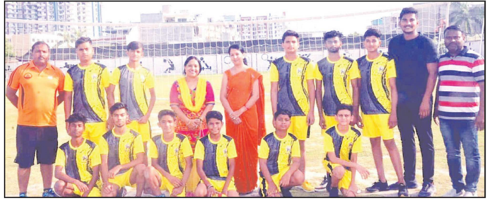
घवनिता थ्रोबॉल टीम।