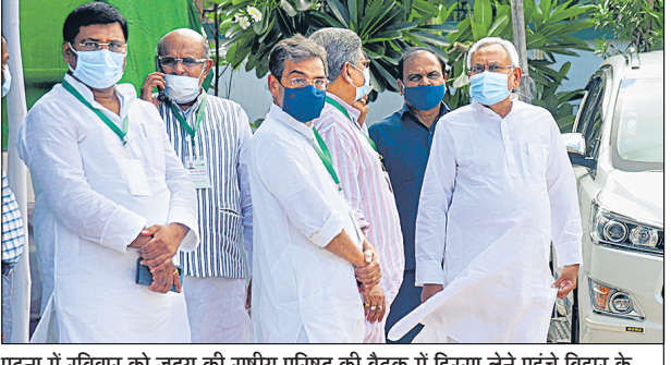
पटना में रविवार को जदयू की राष्ट्रीय परिषद की बैठक में हिस्सा लेने पहुंचे बिहार के मुख्यमंत्री नीतीश कुमार, राष्ट्रीय अध्यक्ष ललन सिंह और उपेंद्र कुशवाहा।