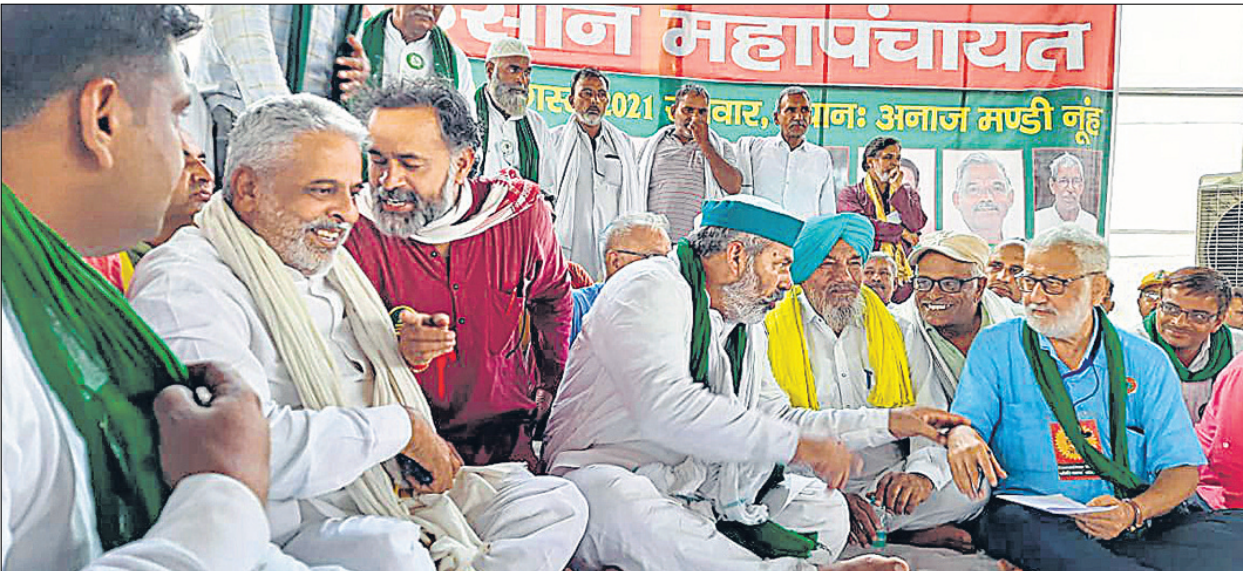
हरियाणा के नूंह में रविवार को किसान महापंचायत के दौरान किसान नेता राकेश टिकैत और योगेंद्र यादव अन्य किसान नेताओं से बातचीत करते हुए।