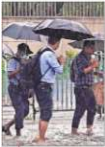
कोलकाता में मंगलवार को तीन बहिन एक ही सड़क पर चलने हुए।