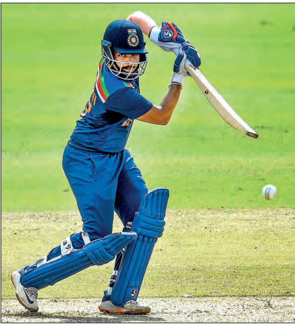
কাজে এল না পৃথিবী লড়াই। শুক্রবার কলকাতায়।