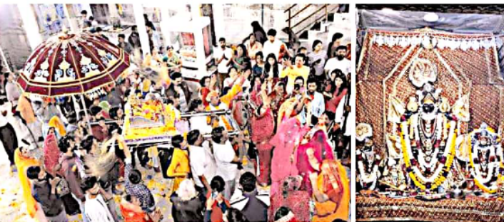
उदयपुर। मंगलवार को येन उठनी एकदसी के अन्तर पर जगदीश मंदिर में तुलसी विवाह का आयोजन हुआ, जिसमें बड़ी संख्या में श्रद्धालु उमड़े। मंदिर में टाकुर जी की शारात बिकारी गई, जिसने मंगल-पुष्पों से जगदीश पूजा किया। फिर उनके बाद विधि-विधान से तुलसी विवाह का आयोजन किया गया। जगदीश मंदिर परिसर टाकुर जी के भक्तों व जगदीशों से गुंज उठा।