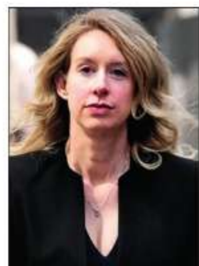
Elizabeth Holmes , California, company.