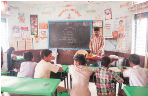
More than 14,000 schools, including Kendriya Vidyalayas and Navodayas as well as schools run by states and local bodies will be strengthened to emerge as PM-SHRI Schools

The government expects this scheme to benefit 1.87 million students and these schools will be monitored vigorously to assess progress and understand the challenges faced in the implementation of the new National Education Policy (NEP), 2020. "PM-SHRI will provide high-quality education in an equitable, inclusive and joyful school environment that