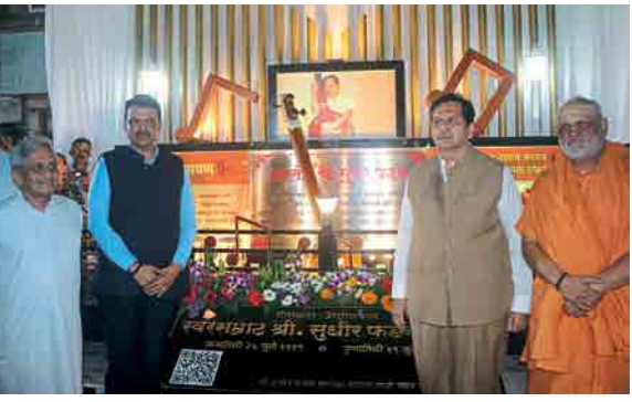
मुंबई : संगीतकार सुधीर फडके यांच्या स्मरणार्थ गावदेवी येथे क्यू आर कोड चौक उभारण्यात आला. याचे उद्घाटन करताना उपमुख्यमंत्री देवेंद्र फडणवीस, मंत्री मंगलप्रभात लोढा आणि मान्यवर उपस्थित होते.