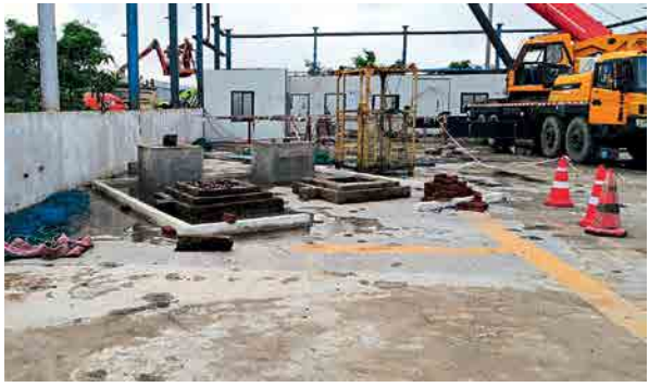
उलवे : तिरुपती मंदिराच्या भूखंडावर बांधलेले कुंड.

नवी मुंबई, ता. ३० : नवी मुंबईतील उलवे येथे सिडकोने तिरुपती व्यंकटेश्वर स्वामी मंदिराला दिलेला भूखंड हरित लवादाच्या काजीरी सापडला आहे. या भूखंडामुळे खारफुटी आणि सागरी जैवविविधतेचे नुकसान होत असल्याप्रकरणी नॅट कनेक्ट फाउंडेशनतर्फे याचिका दाखल करण्यात आली आहे. त्यावर हरित लवादाने महाराष्ट्र कोस्टल मॅनेजमेंट झोन अधीन (एमसीझेडएम्प) आणि मुख्य वनसंरक्षकांना नोटीस नवावत शपथपत्र सादर करण्याचे आदेश दिले आहेत.