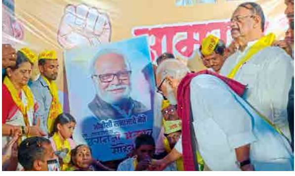
शहापूर : उपोषण सोडवताना छगन भुजबळ.

खर्डी, ता. ३० (बातमीदार) : 'मराठा आरक्षणाला आमचा अजिबात विरोध नाही; मात्र ओबीसींच्या आरक्षणाला धक्का न लावता मराठा आरक्षण जाहीर करावे, आमचे आम्हाला ह्या, आमच्या ताटात वाटेकरी होऊ नका, दबलेल्या-पिचलेल्या लोकांना वर आणण्याची आमची भूमिका आहे. तुम्ही आमची परीक्षा बघू नका, आम्ही पण लहू शकतो यासाठी ओबीसींची जातगणा करा; मग आमची ताकद कळेल', असा इशारावाचा आव्हानच राज्याचे अन्न व नागरी पुरवठा मंत्री छगन भुजबळ यांनी आज दिले आहे.