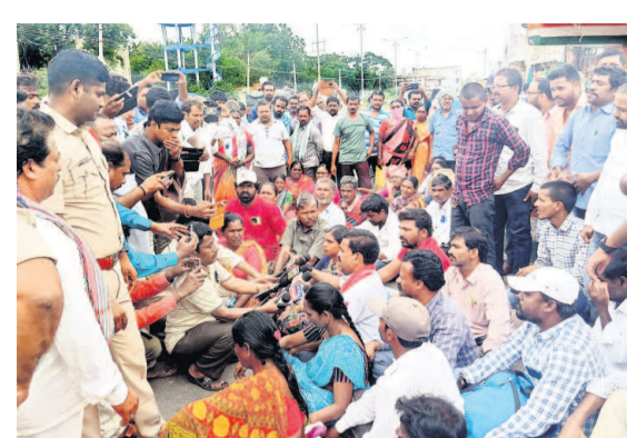
కార్యాలయం వద్దకు మీడియాను పోలీసులు అనుమతించలేదు.

అధికారుల తీరుపై హైకోర్టు అసహనం అభ్యంతరాలు పరిగణనలోకి తీసుకోవాలని సర్కారుకు ఆదేశం సవలెంగాణ - హైదరాబాద్ బ్యూరో ఫార్యాంటిలో భూసేకరణపై హైకోర్టు శుభ్రావగాం కీలక తీర్పు ఇచ్చింది. యాచారం మేడలం మేడిపల్లిలో భూసేకరణ కోసం రాష్ట్ర ప్రభుత్వం జారీ చేసిన నోటిఫికేషన్లను రద్దు చేసింది. మేడిపల్లి, కుర్నూరులో భూసేకరణ పరిహారం ఉత్తరువును ఉద్ధృత న్యాయస్థానం రద్దు చేసింది. భూసేకరణ విషయంలో అధికారుల తీరుపై తీవ్ర అసహనం వ్యక్తం చేసింది.