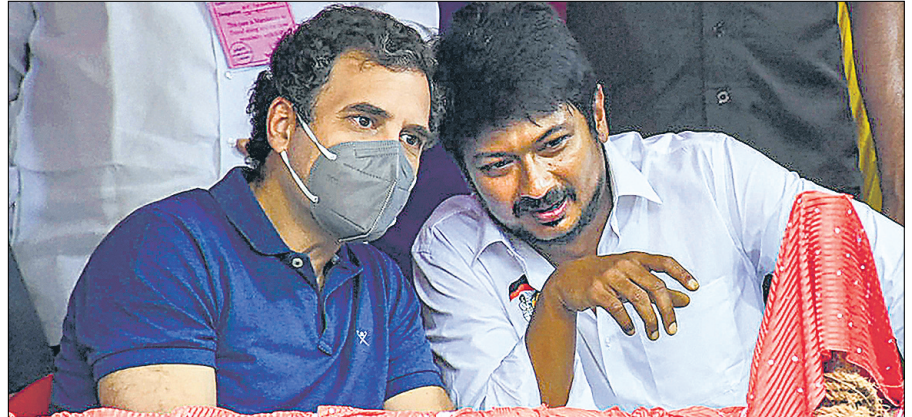
मद्रुरे के अवनियापुरम में गुरुवार को जल्लिकट्टू देखते कांग्रेस नेता राहुल गांधी और डीएमके के सचिव उदयनिधि रत्नलिन।

सुंबई | राष्ट्रवादी कांग्रेस पार्टी (एनसीपी) प्रमुख शरद पवार ने गुरुवार को कहा कि कृषि कानूनों को लेकर गतिरोध को खत्म करने के लिए उच्चतम न्यायालय द्वारा गठित समिति में पूरी तरह स्वतंत्र व्यक्तियों को नियुक्त किया जाना चाहिए था। पवार ने कहा, आंदोलनकारी किसानों को समिति पर विश्वास नहीं है क्योंकि यह कहा गया है कि इसके सदस्य पहले केंद्र के नए कृषि कानूनों का समर्थन कर चुके हैं। लिहाजा, किसानों को नहीं लगता कि समिति से चर्चा करके कोई हल निकलेगा।