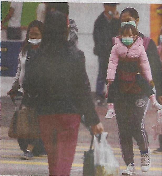
PTI ■ BEIJING

er way. The UK, Australia, South Korea, Singapore monitor them for symptoms and avoid contagion