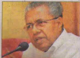
सरकार कानून का दुरुपयोग नहीं होने देगी