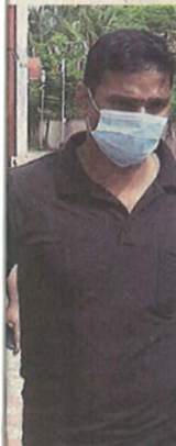
சென்னை உள்நிலைவாறு தீர்ப்போட்ட நிலையில்

நலம் அரசிடம் ஒப்படைக்கப்படாத வதன் மூலம், அதில் உள்ள அசையும் மற்றும் அசையா சொத்து களும் சுகாதாரத் துறை வசம் ஒப்படைக்கப்படும். இதற்குரிய இழப்பீட்டுத் தொகை, அண்ணாமலை பல்கலைக்கழகத்துக்கு வழங்கப்படும் கூடுதல் மானிய உதவிகளில் ஈடுசெய்யப்படும். நிதித் துறையின் ஒப்புதல் பெற்று, பணியாளர்கள் நிலவரம், இடங்களை நிரப்புவது மற்றும் கல்விக் கட்டணம், தமிழ்நாடு டாக்டர் எம்ஜிஆர் மருத்துவ பல்கலைக்கழகத்துடன் இணைப்பு அங்கீகாரம் ஆகியவை தொடர்பாக சுகாதாரத் துறை மூலமாக தனி அரசாணை வெளியிடப்படும். இவ்வாறு அதில் கூறப்பட்டுள்ளது.