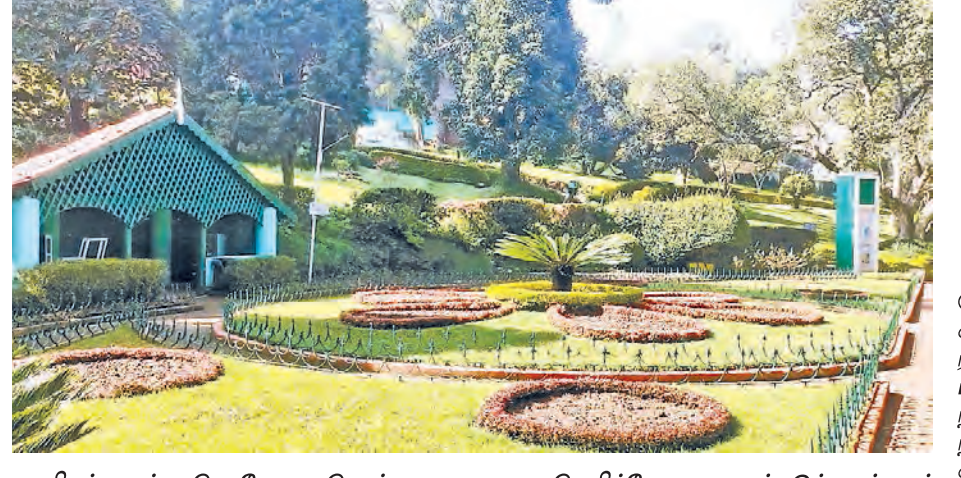
ஊழியர்களுக்கு கொரோனா தொற்று காரணமாக வெறிச்சோடி காணப்படும் குன்னூர் சிம்ஸ் பூங்கா.