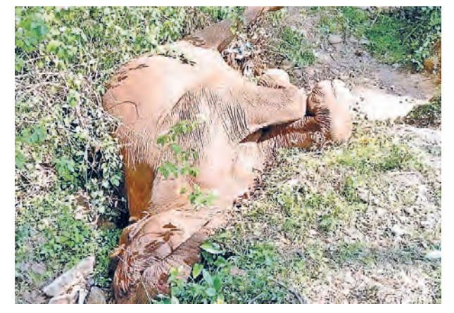
சத்தியமங்கலம் அடுத்துள்ள கடம்பூர் மலைப்பகுதி உகினியம் வனப்பகுதியில் அகழியில் விழுந்து இறந்த பெண் யானை.

லக்குறைவால் இறந்ததா? என்பது குறித்து பிரேத பரிசோதனைக்கு பின்பு . கிடப்பதை கண்டீனர். தெரியவரும் என வனத்து இதுகுறித்து உடனடியாக றையினர் தெரிவித்தனர்.