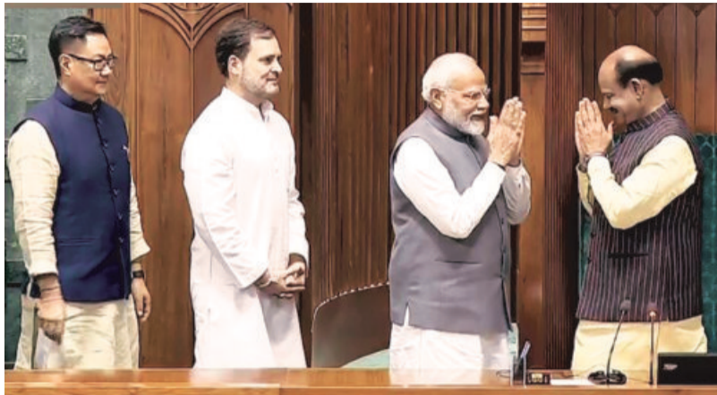
Prime Minister Narendra Modi (second from right), LOP Rahul Gandhi, and Union Minister for Parliamentary Affairs Kiren Rijiju greet Om Birla after he was elected Speaker of the Lok Sabha on Wednesday

The election of the Speaker, however, took place amicably, Congress' Jairam Ramesh later said the INDIA bloc didn't insist on a division of votes as it wanted a "spirit of consensus and cooperation to pre-