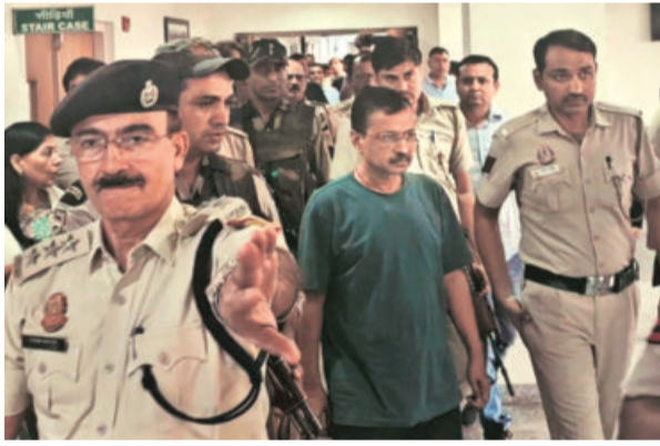
Delhi Chief Minister Arvind Kejriwal being produced before the Rouse Avenue Court in New Delhi on Wednesday

The CBI on its part accused Kejriwal of making "unnecessary allegation of malice".