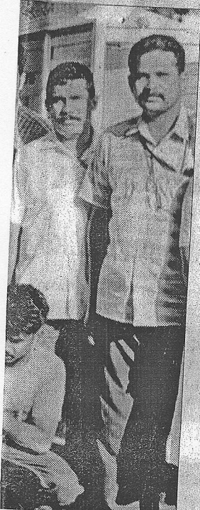
ന മാതൃക മയംകൊണ്ടുനായി മേടത്തൊടിയിൽ സച്ചിൻ, യിലായപ്പോൾ.