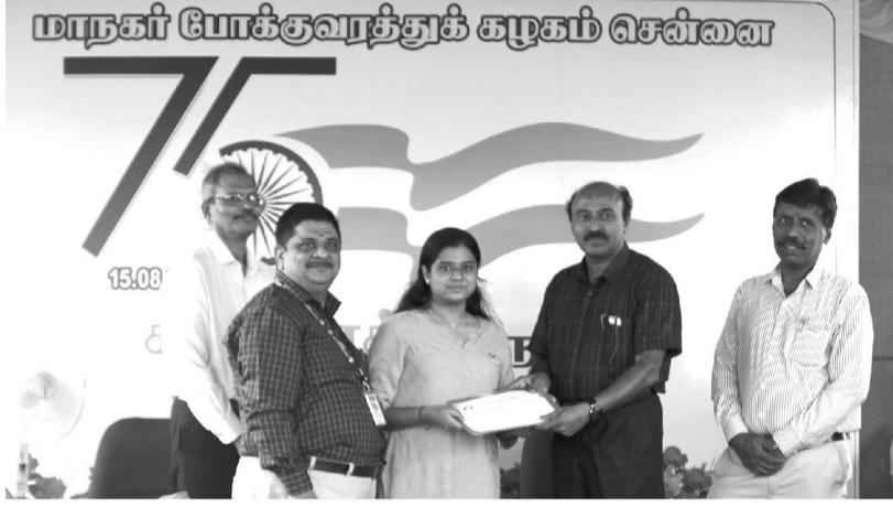
மாநகர் போக்குவரத்துக் கழகம் சென்னை கழகத்தில் ஒரு லிட்டர் எரிவாயுக்கு அதிக அளவில் கிலோ மீட்டர் இயக்கி சாதனை புரிந்த 61 ஓட்டுநர்களுக்கும், ஜனவரி 2022 முதல் ஜூன் 2022 வரை சராசரி வசூல் தொகையைவிட அதிகம் ஈட்டியுள்ள 31 நடத்துநர்களுக்கும், சிறந்த முறையில் தொழில்நுட்ப பணியினை மேற்கொண்ட 31 தொழில்நுட்பப் பணியாளர்களுக்கும், மாநகர் போக்குவரத்துக் கழக பாதுகாப்பு மற்றும் பயிற்சி பிரிவில் சிறந்த முறையில் பணியாற்றிய 6 அலுவலர் மற்றும் பணியாளர்களுக்கும், 01.04.2021 முதல் 31.03.2022 வரை அதிக அபராதத் தொகை வசூல் செய்த 9 பரிசேதாதர்கள் குழு, மண்டல