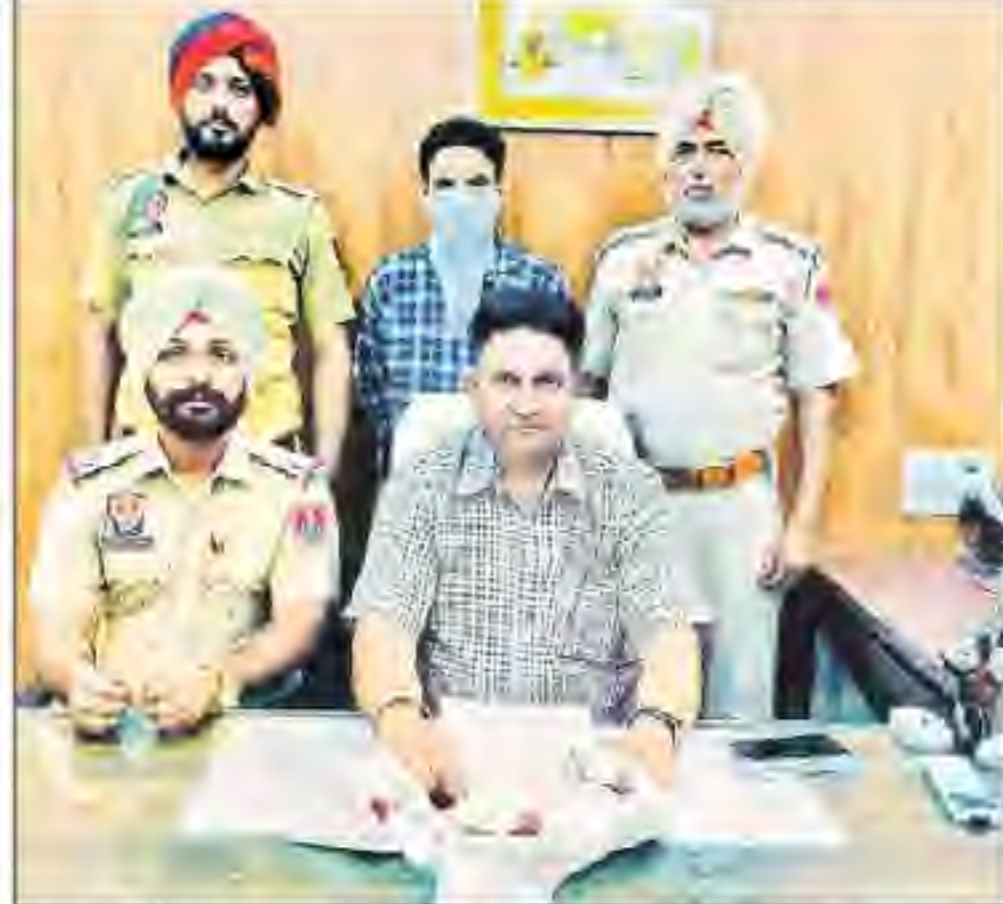
ਕਾਬੂ ਕੀਤੇ ਗਏ ਨੌਜਵਾਨ ਬਾਰੇ ਜਾਣਕਾਰੀ ਦਿੰਦਿਆਂ ਪੁਲਿਸ ਅਧਿਕਾਰੀ।