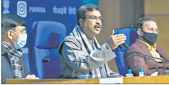
नई दिल्ली में बुधवार को कैबिनेट फैसलों की जानकारी देते पेट्रोलियम मंत्री धर्मप्र प्रधान, केंद्रीय मंत्री प्रकाश जावड़ेकर और मनसुख मांडविया।

केंद्रीय मंत्रिमंडल ने आकाश मिसाइल प्रणाली के निर्यात को मंजूरी प्रदान कर दी है। निर्यात की मंजूरी प्रक्रिया को तेज करने के लिए रक्षा मंत्री राजनाथ सिंह के नेतृत्व में एक समिति गठित की गई है, जिसमें विदेश मंत्री एस. जयशंकर एवं राष्ट्रीय सुरक्षा सलाहकार शामिल किए गए हैं। आकाश मिसाइल को देश में विकसित किया गया है। यह 96 फीसदी तक स्वदेशी है। सतह से हवा में 2.5 किलोमीटर तक मार करने में यह सक्षम है। 2014 में इसे वायुसेना, 2015 में थलसेना में शामिल किया गया था और बेहद सफल उपयोग हो रहा है। रक्षा प्रदर्शनियों के दौरान विभिन्न देशों ने इस मिसाइल की खरीद में इच्छा जताई थी। देश में रक्षा उपकरणों में कल-पुर्जों के