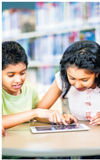
The Indian edtech market is expected to grow 3.7 times to become a $10 billion opportunity by 2025, says an expert.

Despite the covid-led disruption, 11 startups turned unicorns in India, joining the billion-dollar or more valuation club, across sectors such as edtech, beauty and fashion, software-as-a-service (SaaS) and payments. Unicorns such as food delivery firm Zomato and edtech platform Byju's emerged at the top of the most-funded startups this year. Zomato raised $660 million, touching a $3.9 billion valuation, with 10 new investors coming onboard, ahead of a planned initial share sale next year. Founder and chief executive Deepinder Goyal tweeted recently that Zomato is on track to post its best-ever monthly sales in December.