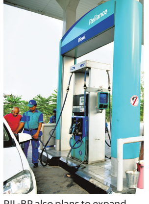
RIL-BP also plans to expand retail outlets from 1,400 to 5,500, an official said.

Reliance BP Mobility Ltd, a joint venture between Reliance Industries Ltd (RIL) and UK's energy major BP Plc, is planning to offer doorstep delivery service of diesel in 2021, said two officials aware of the development. Reliance BP Mobility, which was formed in July, will operate under the Jio-BP brand. "RIL plans to enter on-demand fuel delivery in a big way. It has procured around 100 mobile delivery trucks. The company will begin operations next year," said one of the two officials. RIL will begin pilots in Bengaluru, Noida, Kolkata and Gujarat, he added. RIL did not respond to an emailed query till press time. The second official said RIL-BP also plans to expand retail outlets from 1,400 to 5,500, an official said.