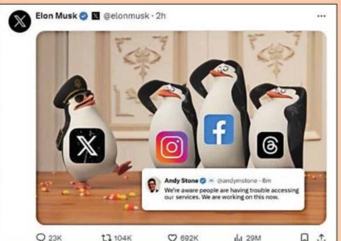
প্রতিপক্ষ সোশ্যাল মিডিয়া প্ল্যাটফর্মগুলির গ্লোবাল আউটরেজ-এর পরে এ ভাবেই নিজের তেরিফায়েড এঞ্জ হ্যাভেল (প্রাক্তন টুইটার) থেকে বিরূপ করলেন ইলন মাস্ক

কিনেছে। মঙ্গলবার এক রিপোর্টে জানিয়েছে এসঅ্যান্ডপি গ্লোবাল। এইচএসবিসির সঙ্গে হাত মিলিয়ে চালানো সমীক্ষায় এই তথ্য সামনে এনেছে আন্তর্জাতিক উপদেষ্টা সংস্থাটি।