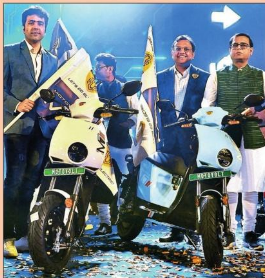
মোটোভোজ-এর চমক ভারতের প্রথম মাল্টি ইউটিলিটি ই-স্কুটার বাজারে নিয়ে এল মোটোভোজ মোবিলিটি।