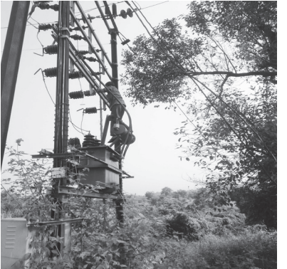
गावे विजसमस्येने बेजार झाले आहेत. एकदा विजपुरवाडा खंडीत झाला की विजपुरवाडा केव्हा सुरळीत होईल याचा नेम नसल्याने महिलावागीतून विजवितरण विभागाच्या कारभाराविरोधात संतापाची लाट उसळली आहे. दिवसभर काबाड कष्ट करून घरी परतलेल्या शेतकरी वार्गसह कामगारांना खंडीत विजपुरवठ्याचा मोठा फटका बसत आहे. पावसाळ्यात सातत्याने खंडीत होणाऱ्याह विजपुरवठ्याने नागरीक वस्त झाले होते. अशातच ऐन सणासुदीच्या दिवसात देखिल विद्युत पुरवठा वारंवार खंडीत होत असल्याने सणाच्या उत्साहावर विरजन पडत आहे.

पाली-बेगसे, दि. ५ सुधागड पालीकर असल्याचा इशारा नागरीकांनी दिला आहे. यातच कहर म्हणजे विजपुरवाडा खंडीत झाल्यानंतर येथील नागरीक विजवितरण कर्मचाऱ्यांशी संपर्क साधण्याचा प्रयत्न करतात. मात्र त्यांचे मोबाईल नॉटरिचबल येत असल्याने नागरीकांना असंख्य अडचण्यां सामोरे जावे लागत आहे. विशेष म्हणजे विजपुरवठ्यावर अवलंबून असलेला पाणीपुरवठा बंद झाल्याने पिण्याच्या पाण्यासह घरगुती कामासाठी वापरात येणारे पाणी मिळविण्यासाठी महिलावागींचा ठेी फरफट होत आहेत.