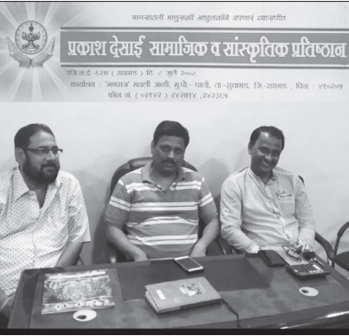
तून आजवर विविधांगी गुणदर्शी, क्रिडात्मक व समाजाभिमुख कार्यक्रम राबविण्यात आले आहेत. नवीदत कलाकारांना आपली कला सादर करण्यासाठी मागील अनेक वर्षापासून हे प्रतिष्ठान राबवित असलेले खुली राज्यस्तरीय एकांकिका स्पर्धा म्हणजे कलाकारांना हक्काचे व्यासपिठ असते. तर या एकांकिका स्पर्धा म्हणजे कलाप्रेमींसाठी अगळीवेगळी पर्वणी असलेला