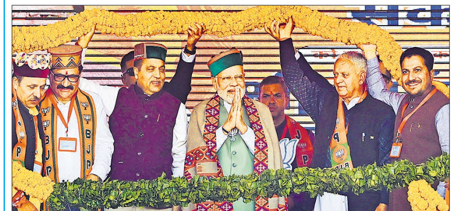
● ਸੁੰਦਰਨਗਰ (ਮੰਡੀ) ਵਿਖੇ ਚੋਟ ਰੋਲੀ ਦੌਰਾਨ ਪ੍ਰਧਾਨ ਮੰਤਰੀ ਨਰਿੰਦਰ ਸਿੰਘ ਨੂੰ ਸਨਮਾਨਿਤ ਕਰਦੇ ਹੋਏ ਮੁੱਖ ਮੰਤਰੀ ਜੈਰਾਮ ਠਾਕੁਰ ਅਤੇ ਹੋਰ ਆਗੂ।

ਗੈਜਟ: PB/JL-138/2021-23 ਜਿਲਦ 67, ਅੰਕ 306 | www.ajitjalandhar.com | www.ajitv.com | Facebook.com/dailyajit | Twitter.com/dailyajitnews | news@ajitpublications.com | ਫ਼ੋਨ : 0181-2455961-62-63, 5032400, ਫੈਕਸ : 2455960