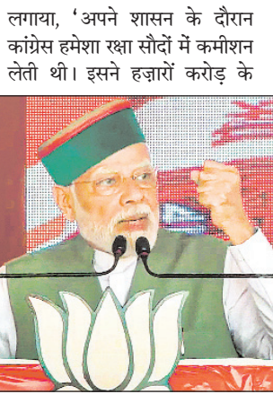
सुन्दरनगर में रैली को संबोधित करते हुए प्रधानमंत्री नरेन्द्र मोदी।

मंडी/सोलन (हिमाचल प्रदेश), 5 नवम्बर (भाषा) : प्रधानमंत्री नरेन्द्र मोदी ने कांग्रेस पर निशाना साधते हुए कहा कि उसने हमेशा हिमाचल प्रदेश की अनदेखी की क्योंकि राज्य छोटा है और उसने लोकसभा में केवल '3 से 4 सांसद' भेजे हैं। मोदी ने यहां सुंदरनगर में एक चुनावी रैली में कहा, 'हम साथ मिलकर हिमाचल को आगे ले जाएंगे, एक नया रिवाज शुरू करेंगे और भाजपा को सत्ता में वापस लाएंगे।' मोदी ने कहा, 'अपनी सोच के कारण कांग्रेस ने कभी भी हिमाचल के विकास को प्राथमिकता नहीं दी और राज्य पिछड़ गया।' उन्होंने कांग्रेस पर भ्रष्टाचार का भी आरोप लगाया और कहा कि सबसे पुरानी पार्टी ने रक्षा क्षेत्र में अपना पहला घोटाला किया। प्रधानमंत्री ने आरोप