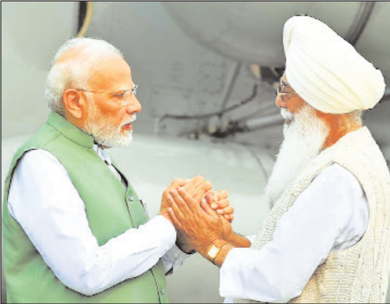
डेरा राधा स्वामी ब्यास प्रमुख बाबा गुरिन्दर सिंह दिल्ली से मिलते हुए प्रधानमंत्री नरेन्द्र मोदी।

वे खुद को 'कट्टर ईमानदार' कहते हैं, लेकिन सबसे भ्रष्ट हैं और समाज को विभाजित करने की साजिश में लगे हैं। उनके इस बयान को कई लोगों ने आम आदमी पार्टी (आप) पर हमले के रूप में देखा। 'आप' अक्सर खुद को 'कट्टर ईमानदार' के रूप में वर्णित करती है और हिमाचल प्रदेश में भारतीय जनता पार्टी (भाजपा) को चुनौती देने के लिए चुनाव मैदान में भी है। कांग्रेस पर निशाना साधते हुए उन्होंने आरोप लगाया कि कांग्रेस का मतलब भ्रष्टाचार, स्वार्थपूर्ण राजनीति और भाई-भतीजावाद की 'गारंटी' है। मोदी ने कहा कि भाजपा के कार्य और संकल्प मजबूत हैं जबकि कांग्रेस में अनिश्चितता, अनिर्णय और