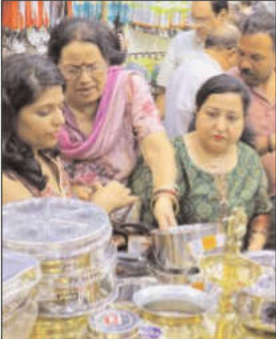
चंडीगढ़ में धनतेरस के त्योहार पर बर्तनों की खरीदारी करते शहरवासी। -जसबीर मल्ली