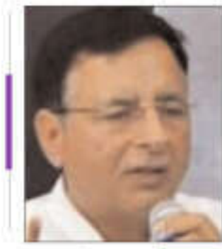
आंदोलन का खमियाजा भुगत रहे हरियाणा के किसान। 3,100 का एलान करके खरीद नहीं की जा रही।

अखिल भारतीय कांग्रेस समिति के महासचिव एवं राज्यसभा सांसद रणदीप सुरजेवाला ने हरियाणा सरकार पर किसानों के साथ षड्यंत्र रचकर न्यूनतम समर्थन मूल्य को समाप्त करने का आरोप लगाते हुए कहा है कि हरियाणा में पंजीकरण के बावजूद तीन लाख किसानों की धान की खरीद नहीं की गई। मंगलवार को चंडीगढ़ में संवाददाताओं से बातचीत में रणदीप सुरजेवाला ने कहा कि तीसरी बार सत्ता में आने के बाद भाजपा अब धान की खरीद न करके किसानों के साथ किसान आंदोलन का बदला ले रही है। सुरजेवाला ने दस्तावेज जारी करते हुए बताया कि हरियाणा में धान के सीजन में एमएसपी पर खरीद के लिए कुल चार लाख 19 हजार 532 किसानों ने पंजीकरण करवाया। प्रदेश में 29 अक्टूबर तक एमएसपी पर एक लाख 33 हजार 114 किसानों की धान खरीदी गई। प्रदेश में दो लाख 86 हजार 418 किसानों की फसल एमएसपी पर नहीं खरीदी गई। हरियाणा में पिछले साल धान की 58 लाख 92 हजार 721 मीट्रिक टन धान की खरीद की गई। इस बार 29 अक्टूबर तक महज 37 लाख