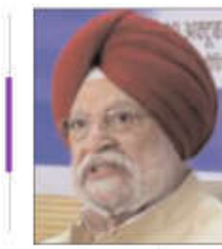
केंद्रीय मंत्री ने कहा कि पंजाब में चल रहे संयंत्र बंद हो रहे हैं। यह बहुत दुःखद स्थिति है।

केंद्रीय पेट्रोलियम एवं प्राकृतिक गैस मंत्री हरदीप सिंह पुरी ने मंगलवार को कहा कि पंजाब को संपीड़ित बायोगैस (सीबीजी) और एथनल संयंत्र स्थापित करने के लिए नए निवेश मिलने चाहिए और उन्होंने इस बारे में मुख्यमंत्री भगवंत मान को कई बार पत्र लिखा है, लेकिन जमीनी स्तर पर कुछ नहीं हुआ। आप शासित पंजाब में कानून-व्यवस्था के मुद्दे पर एक सवाल का जवाब देते हुए पुरी ने कहा कि अगर कानून-व्यवस्था ठीक नहीं है, तो मौजूदा उद्योग भी राज्य छोड़ देंगे। चंडीगढ़ में रोजगार मेले के मौके पर संवाददाताओं से बात करते हुए पुरी ने कहा कि पंजाब के उद्यमियों को राज्य में सीबीजी संयंत्र स्थापित करने के लिए प्रोत्साहित किया जाना चाहिए। उन्होंने कहा, 'मुझे दुःख होता है कि देश में सीबीजी संयंत्र बढ़ रहे हैं, लेकिन यहां (पंजाब) सीबीजी संयंत्र चलाना मुश्किल