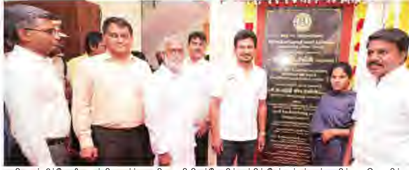
திருவல்லிக்கேணி அருள்மிகு பார்த்தாரதி சுவாமி திருக்கோயில் சார்பில் சேப்பாக்கம் அடியா பிள்ளை தெருவில் குடிசை கட்டடம் திறப்பு விழா.