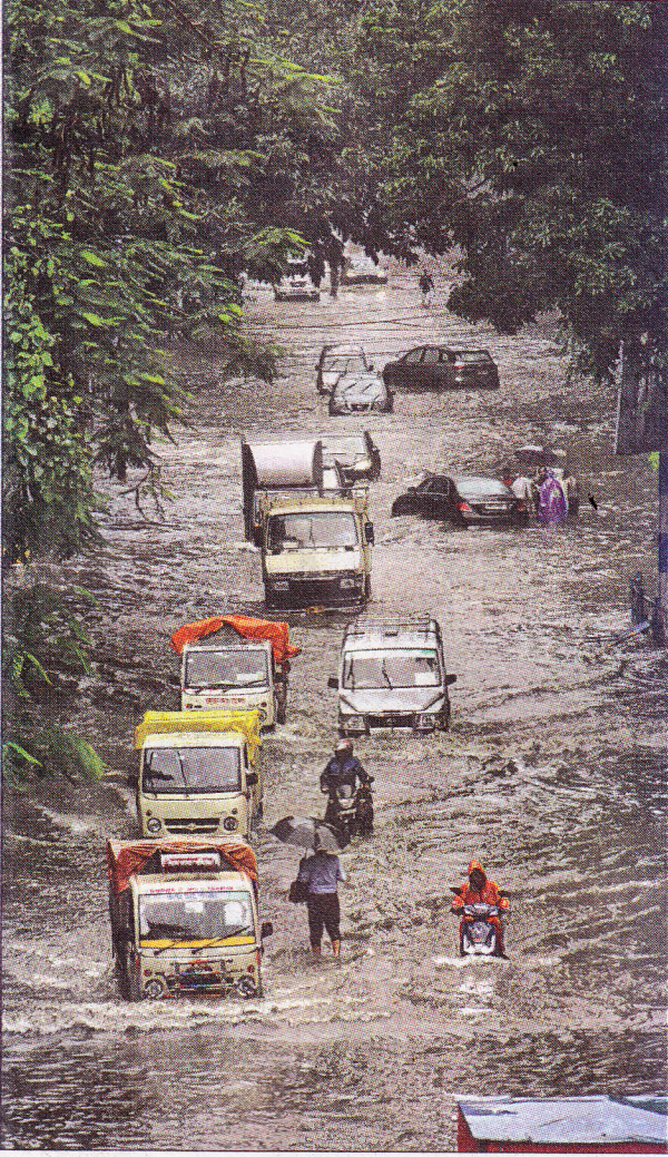
জমা জলে যাতায়াত। শুক্রবার ক্যামাক স্ট্রিটে তোলা

নিজস্ব প্রতিনিধি, বিধাননগর: দুর্গাপুজোকে সামনে রেখে সল্টলেক সহ গোটা বিধাননগরে শুরু হয়েছিল রাস্তা সংস্কারের কাজ। লক্ষ্য ছিল, দীপাবলির আগেই সিংহভাগ রাস্তায় পিচের প্রলেপ দেওয়ার কাজ শেষ করার। কিন্তু, ঘূর্ণিঝড় ডানার কোপে থমকে গেল সেই সংস্কারের কাজ। বৃষ্টির জন্য মেরামতির কাজ বন্ধ রাখা হয়েছে। তবে, রোদ উঠলে ফের কাজ শুরু হবে বলে জানা গিয়েছে। এদিকে, সকাল থেকে টানা বৃষ্টির জেরে শুক্রবার হলদিরাম এলাকায় ভিআইপি রোডের ধারে জল থইথই অবস্থা তৈরি হয়। পারাপার করতে গিয়ে দুর্ভোগ পোহাতে হয় সাধারণ মানুষকে। জমা জলের কারণে বহু বাইকের স্টার্ট বন্ধ হয়ে যায়। জলের মধ্যেই ঠেলে ঠেলে নিয়ে যান তাঁরা। দিনভর চলেছে এই দুর্ভোগ।