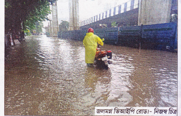
জলমগ্ন ভিআইপি রোড।

পরই হাটসমান জল জমে যায়। দু'দিকের সার্ভিস রোড দিয়ে প্রতিদিন হাজার হাজার মানুষ যাতায়াত করেন। জমা জলের কারণে তাঁদের দুর্ভোগের মধ্যে পড়তে হয়। এলাকার