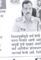
निवडणुकीमुळे सर्व सत्ते जमा करून घेण्यात आली आहे. यापूर्वी गुन्हे दाखल असलेल्या सर्व आरोपींवर प्रतिबंधात्मक कारवाई केली आहे...