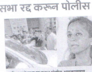
सुप्रिया सुळे सभारू करून पोलीस आयुक्तालयात दरम्यान, राष्ट्रवादी शरद पवार यंत्रणेच्या कारवायु सुप्रिया सुळे आज नाशिक येताय आहेत...