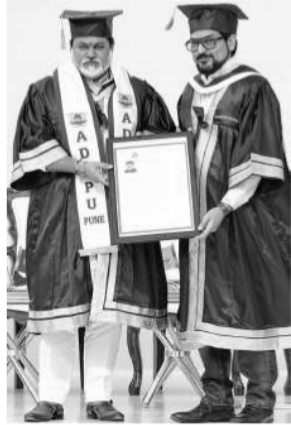
शिक्षणक्षेत्रातील योयदानाचा उल्लेख केला.